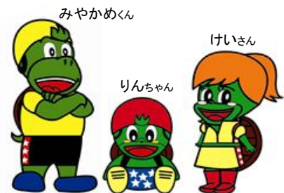
▲みやかめファミリー